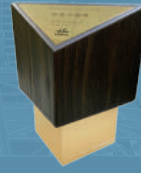
亮點企業研發卓越獎